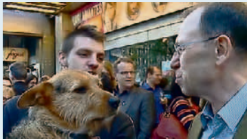
Viktor Giacobbos Film «Der grosse Kanton» feiert Premiere.